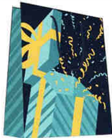
4558CO 4559CO 4560CO